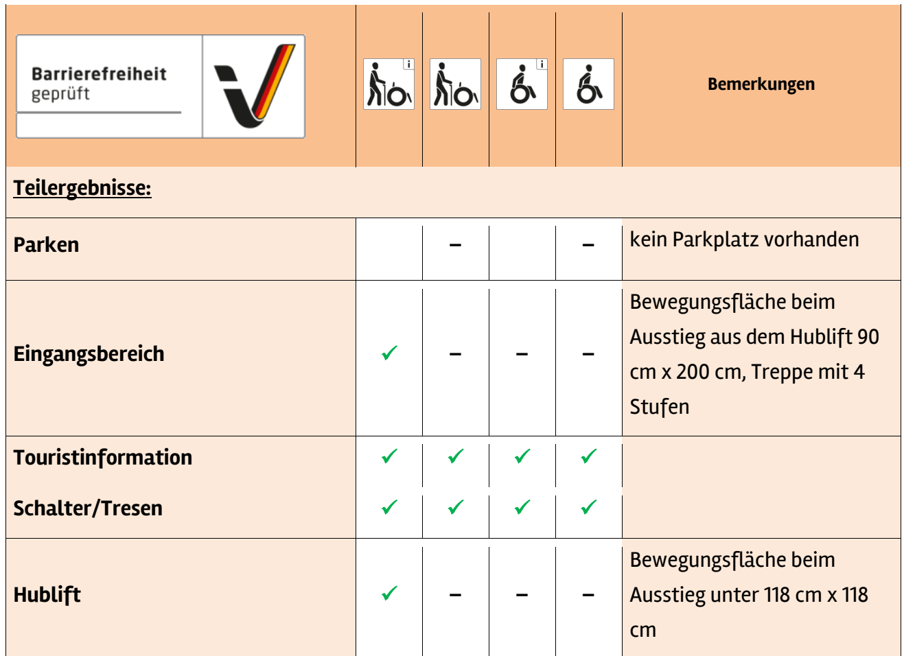
Tabelle 1: Überblick über das Prüfergebnis