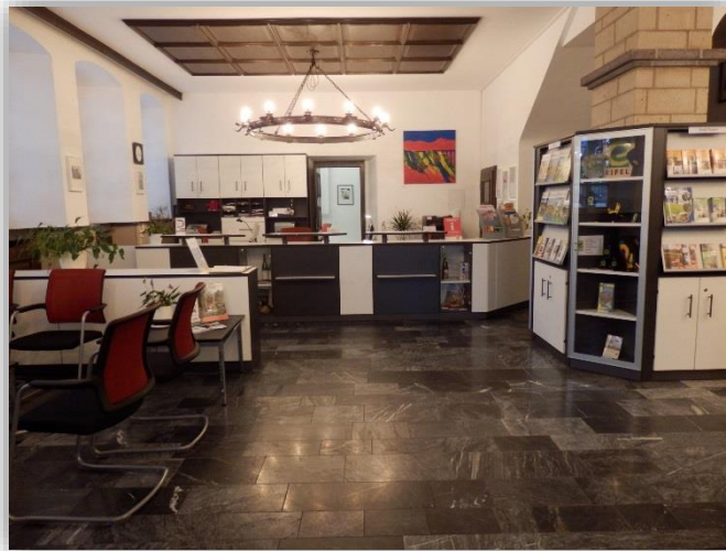
Tourist-Information Stadt Mayen